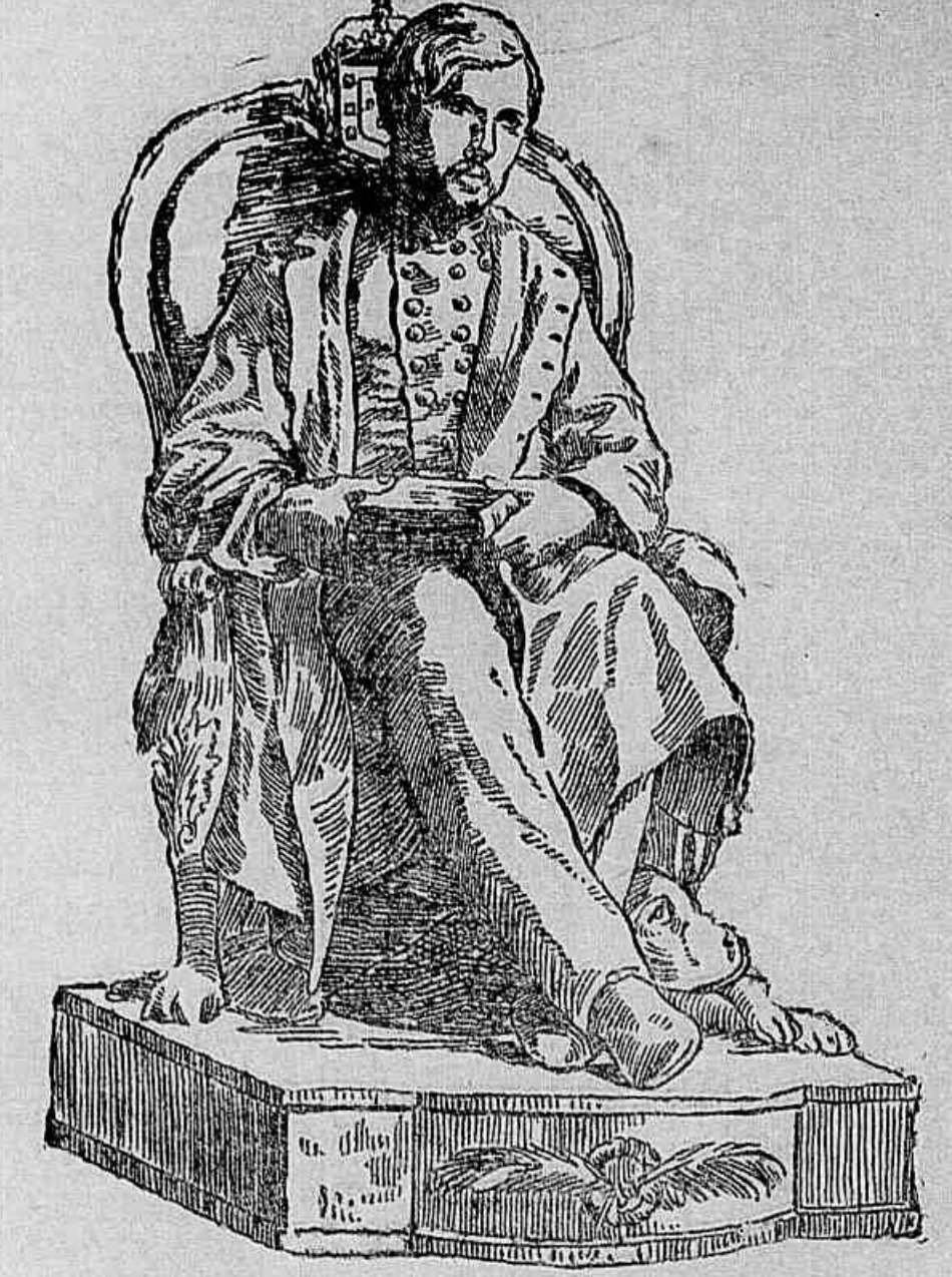
EL-REI D. PEDRO V