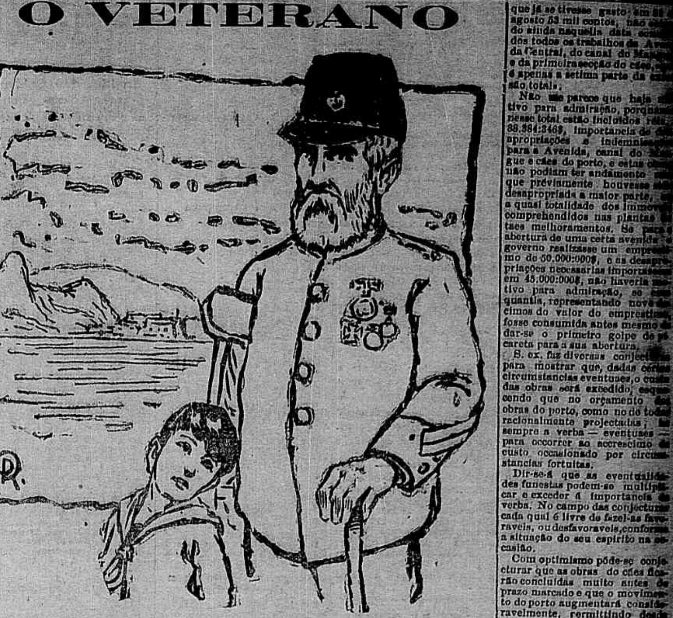
— Que pena você ter cegado no Paraguai! — Hoje, meu filho, é uma felicidade...