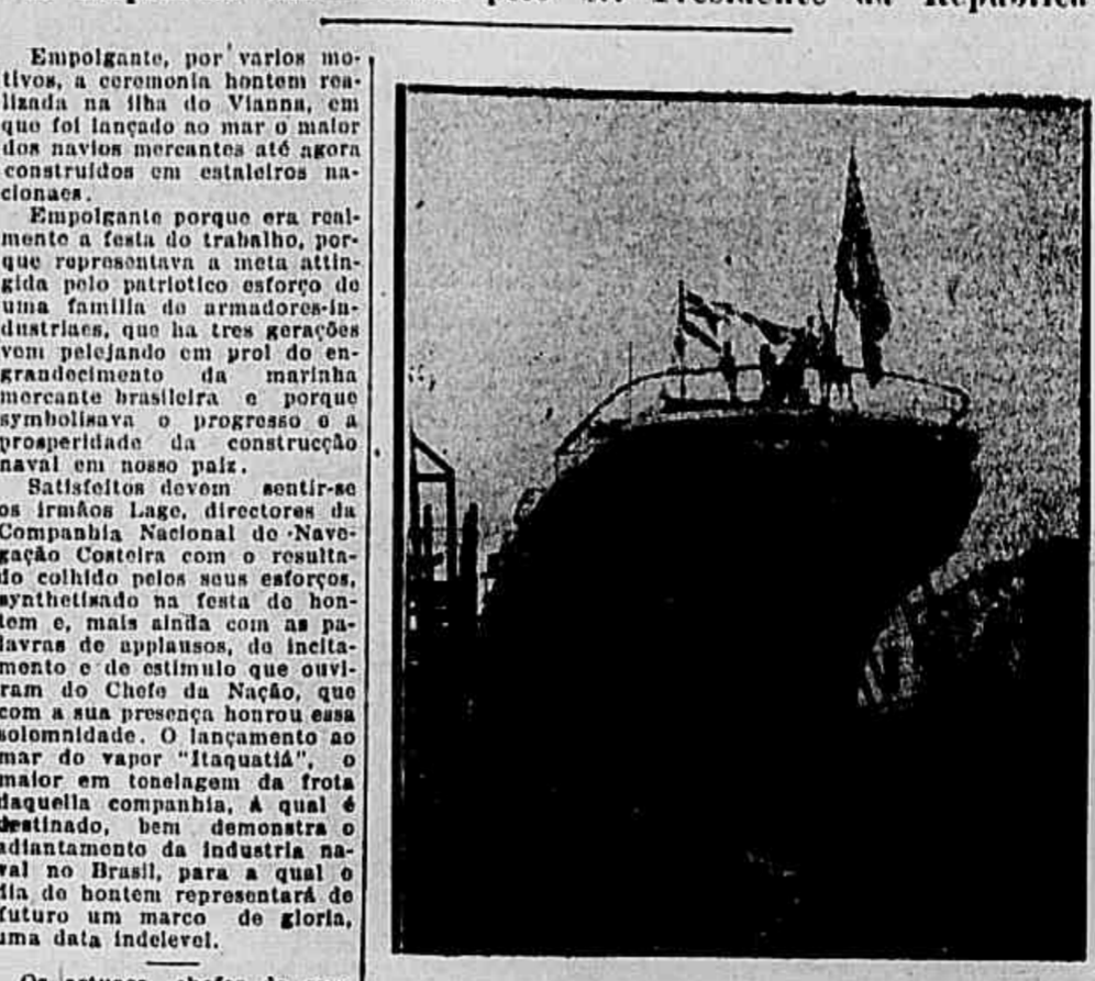
O "Itaquatia" antes de ser lançado ao mar