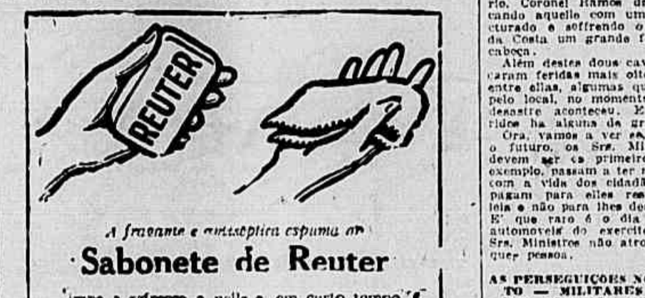
Sabonete de Reuter