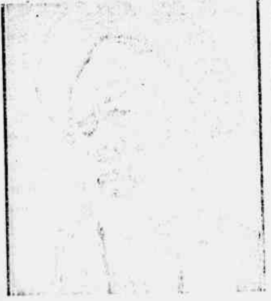
Uma de varias plantações de cana-de-açúcar, em São Paulo, Brasil. Essas plantações de cana-de-açúcar nos Estados Unidos foram muito importantes para a cultura do algodão.