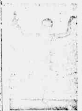
Retrato offerecido pelo Dr. J. Courata de Sant'Anna, ao CLARIM D'ALVORADA

no seu excepcional papel de bahiana?... Não acharam que ella naquele papel caracterizou muito a negra brasileira de outros tempos, mas daquella que fazia gosto vel-as; creio que as impressões foram tão deliciosas da imitadora quanto a bahiana.